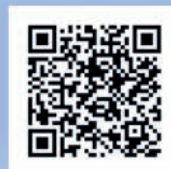
m-lab deck PPT