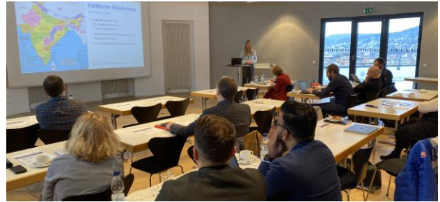
Impressionen einer von SBS organisierten Informationsveranstaltung in Stuttgart

Tel: (0)30 22013397 – E-Mail: m.nistorica@sbs-business.com